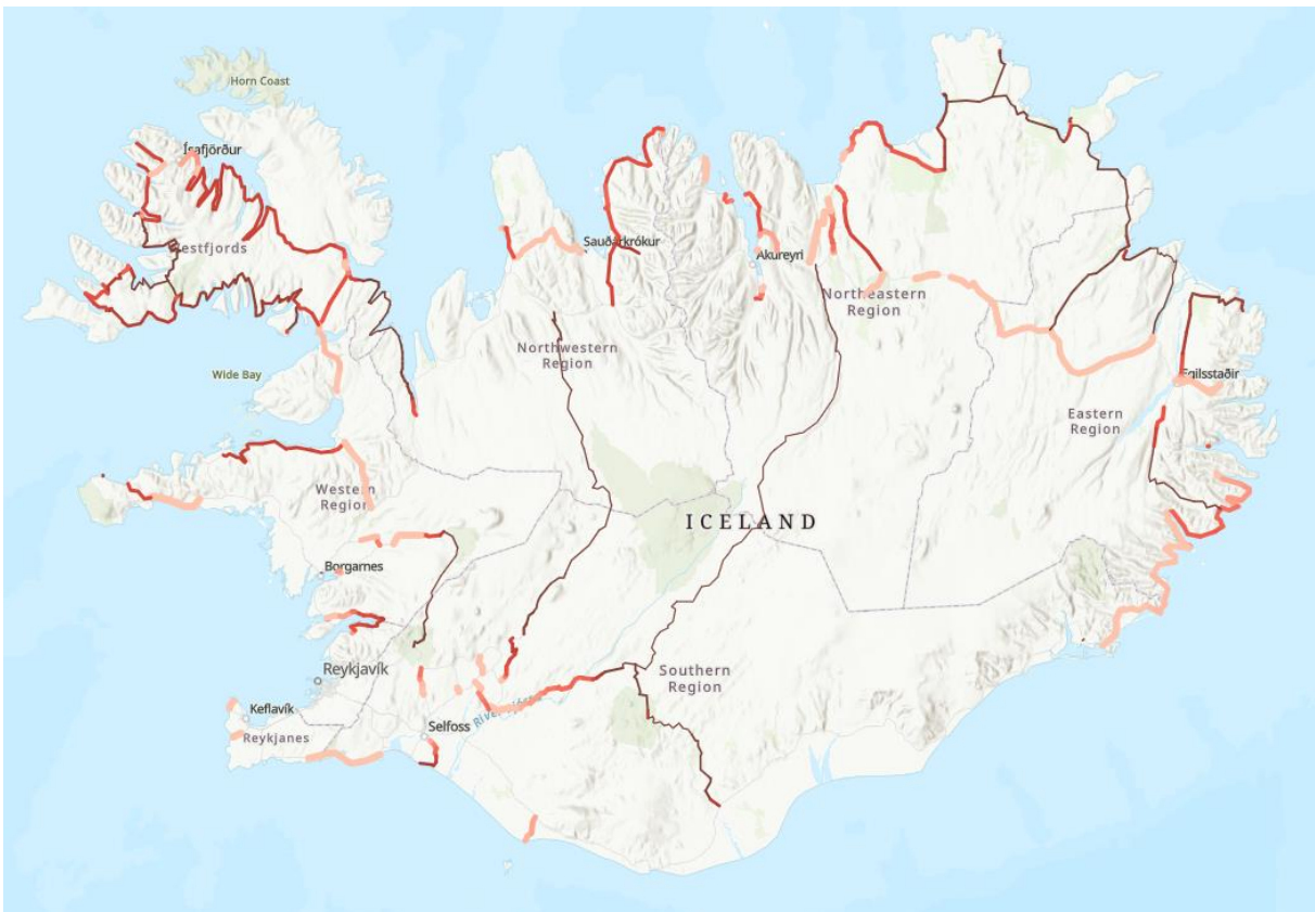
Mynd 2, Vegir sem skilgreindir eru af Fjarskiptastofu og umferð er undir 700 ÁDU, því dekkri og mjórri sem línan er því minni umferð.