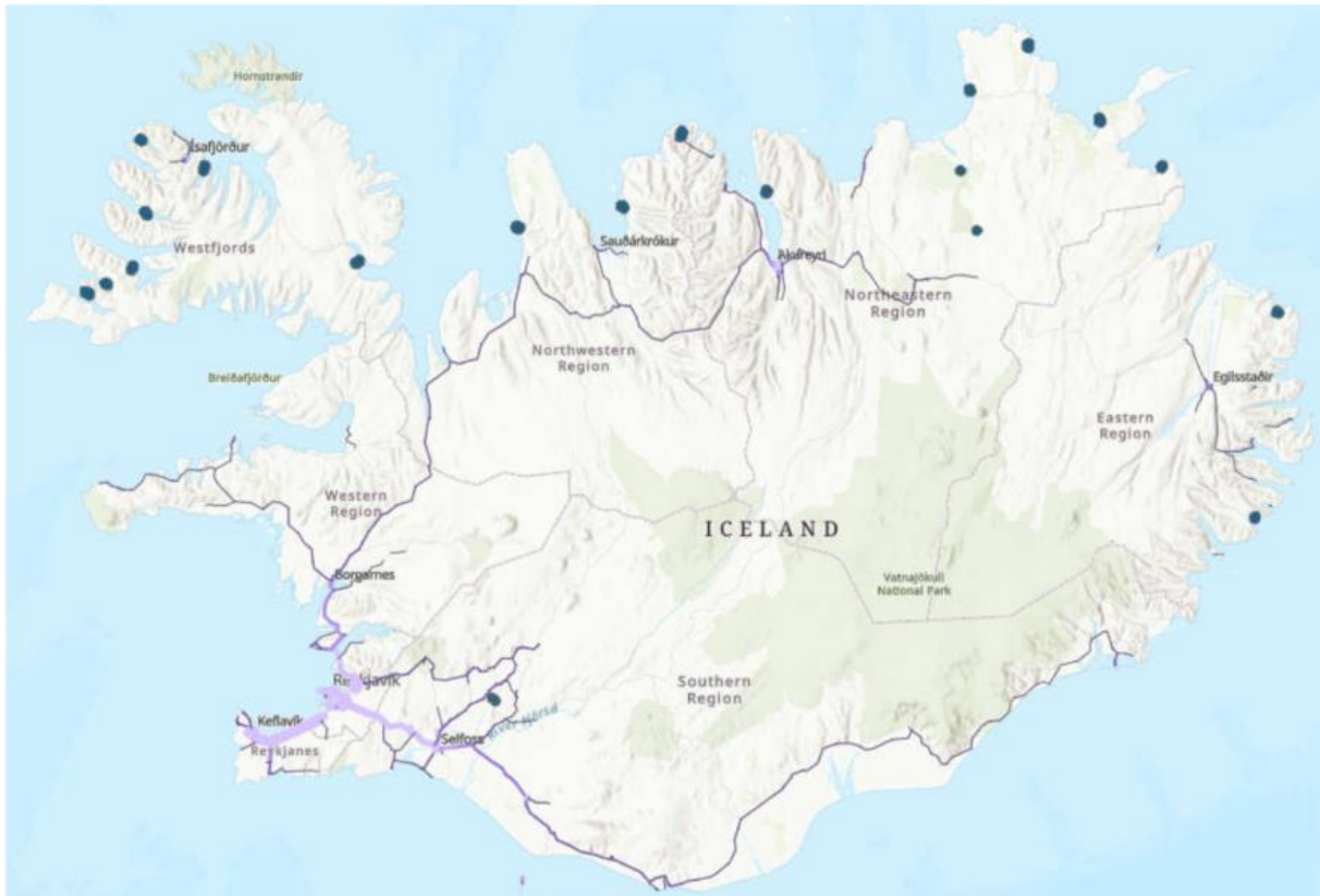
Mynd 1, Vegir þar sem talin er vera markaður fyrir farsímabjónustu auk þéttbýlla svæða utan þessara vega.