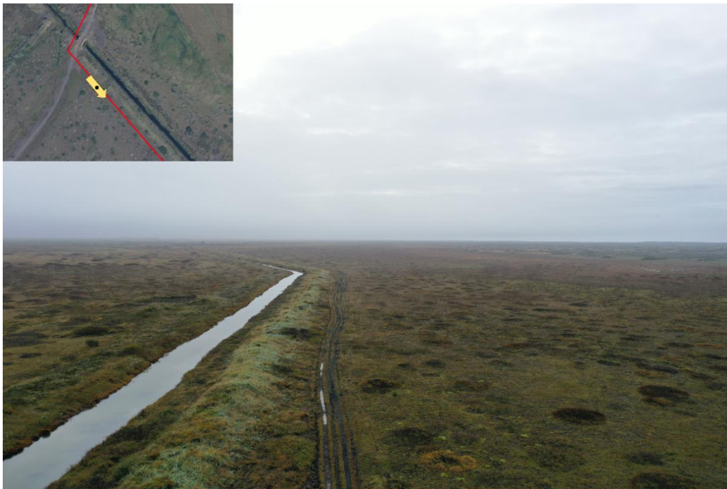
Mynd 4 – Fyrirhuguð lagnaleið liggur hér meðfram þessum vegslóða sem er ofarlega í fjörukambinum. Þessi vegslóði, og sömuleiðis fyrirhugaður strengur, fylgir þessum skurði sem sést hér á myndinni vinstra megin í u.þ.b. einn kílómetra. Strengurinn mun á þessum slóðum liggja á milli skurðarins og vegslóðans.