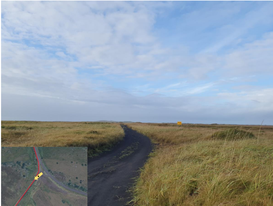
Mynd 3 – Strengurinn mun liggja meðfram þessum vegslóða sem liggur frá Ásvegi og niður í fjöru. Hann mun svo liggja meðfram vegslóða sem liggur samsíða fjörunni í fjörukambinum.