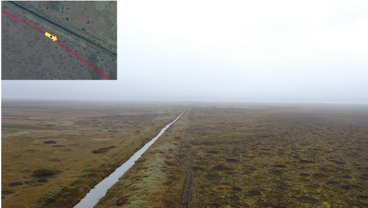
Mynd 5 – Hér má sjá vegslóðann sem strengurinn verður plægður eftir. Vegslóðinn liggur meðfram þessum skurði en sveigir svo frá honum fyrir miðri mynd og heldur áfram samsíða fjörunni.