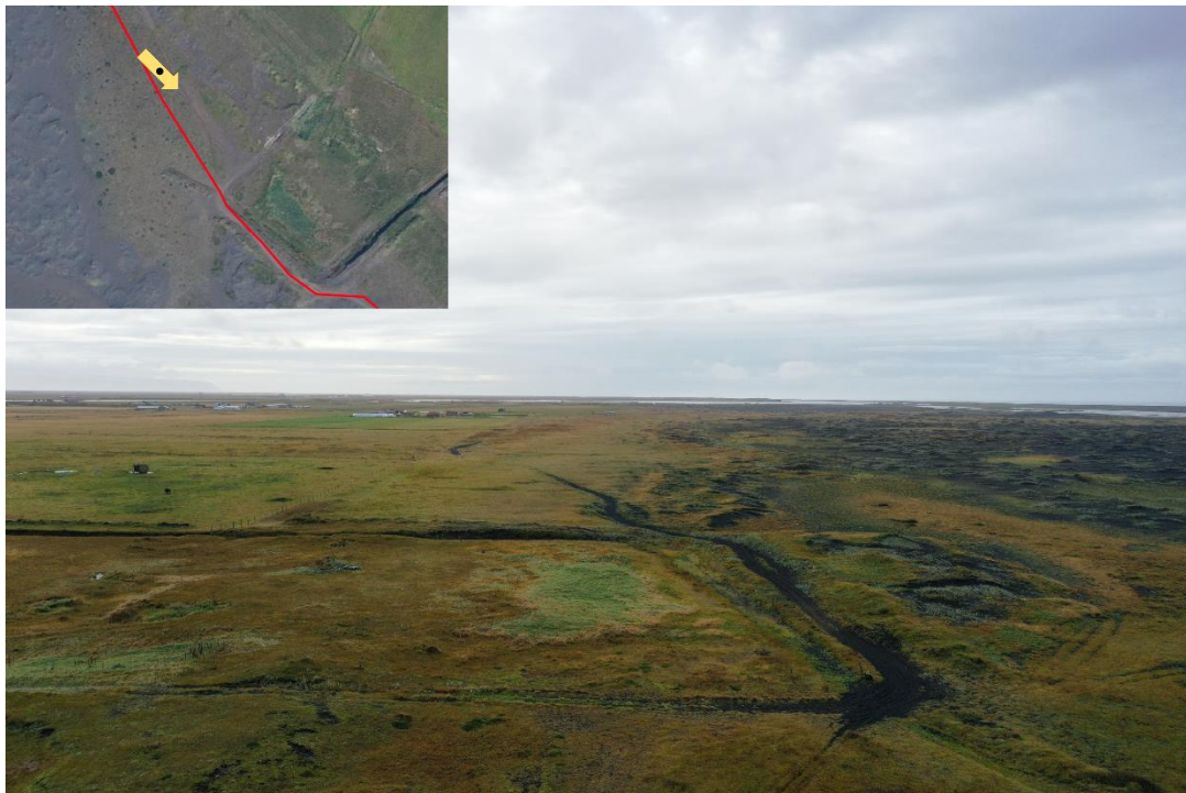
Mynd 8 – Strengurinn verður plægður út frá vegslóðanum sem liggur hér meðfram afgirta svæðinu sem sést hér í forgrunni.