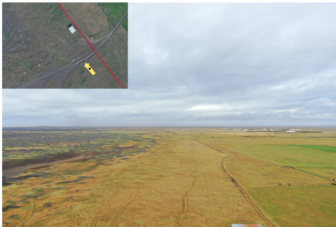
Mynd 10 – Vegslóðinn sem fyrirhuguð lagnaleið liggur meðfram er hér rétt fyrir ofan fjörukambinn.