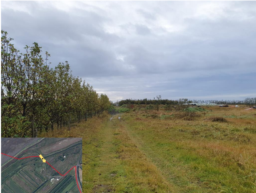
Mynd 1 – Myndin er tekinn á eignarlandi skammt frá því þar sem strengurinn þverar Þjórsá. Út eftir þessum slóða hefur þegar verið plægður strengur í jörð. Eins og sjá má á myndinni eru engin bersýnileg ummerki eftir plæginguna.