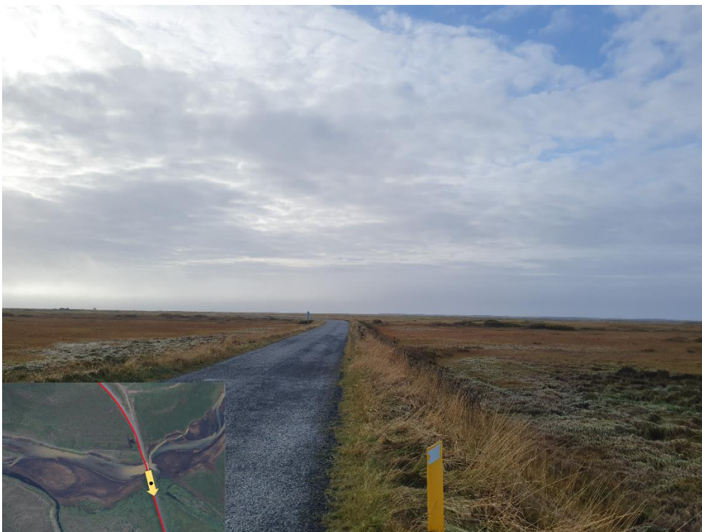
Mynd 2 – Myndin er tekinn í vegkanti Ásvegjar þar sem fyrirhugað er leggja strenginn. Strengurinn mun liggja þarna hægra megin við veginn frá sjónarhorni myndarinnar. Hinum megin við veginn liggur nú þegar ljósleiðari frá örðu fjarskiptafélagi. Fyrirhuguð lagnaleið liggur sunnanmegin við Ásveg þangað til hún sveigir niður í átt að fjörunni meðfram vegslóða sem liggur niður í fjöru.