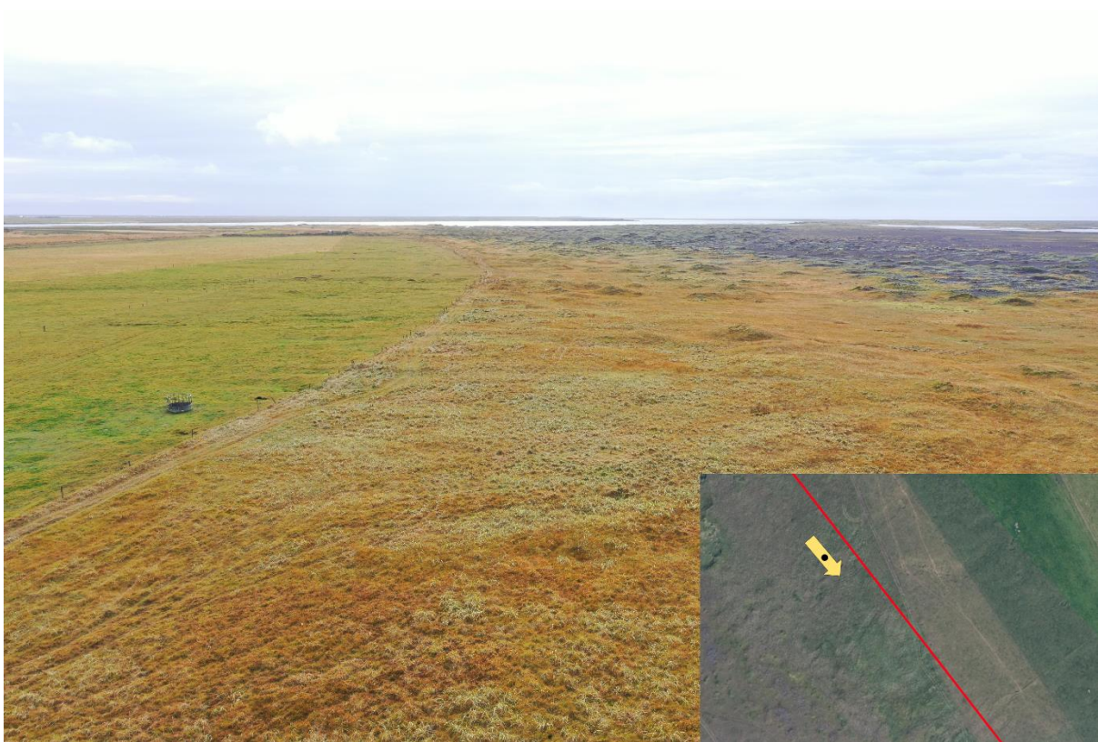
Mynd 11 – Vegslóðinn sést hér vinstra megin á myndinni meðfram afgirtum túnum. Fyrirhuguð lagnaleið liggur meðfram þessum afgirtu túnum áður en hún þverar Hólsá.