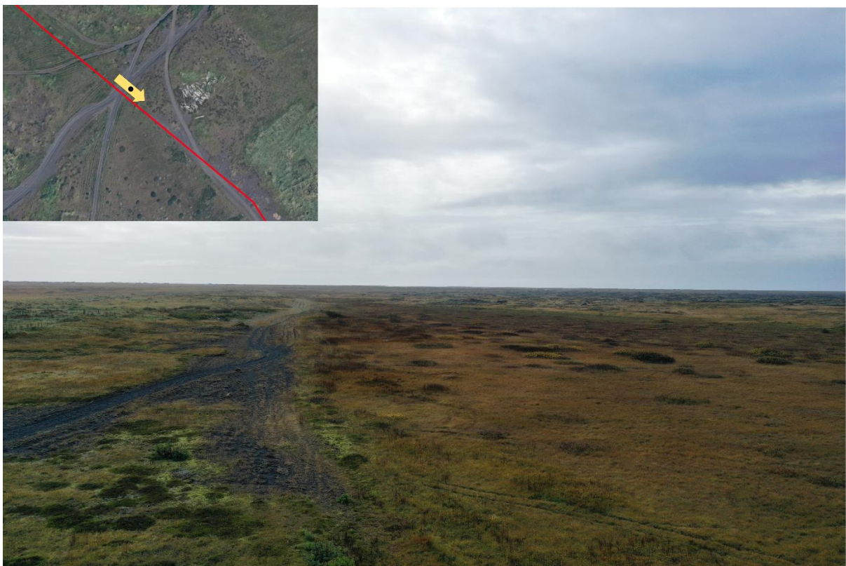
Mynd 6 – Hér má sjá vegslóðann sem strengurinn verður plægður eftir. Vegslóðin liggur ofarlega í fjörukambinum.