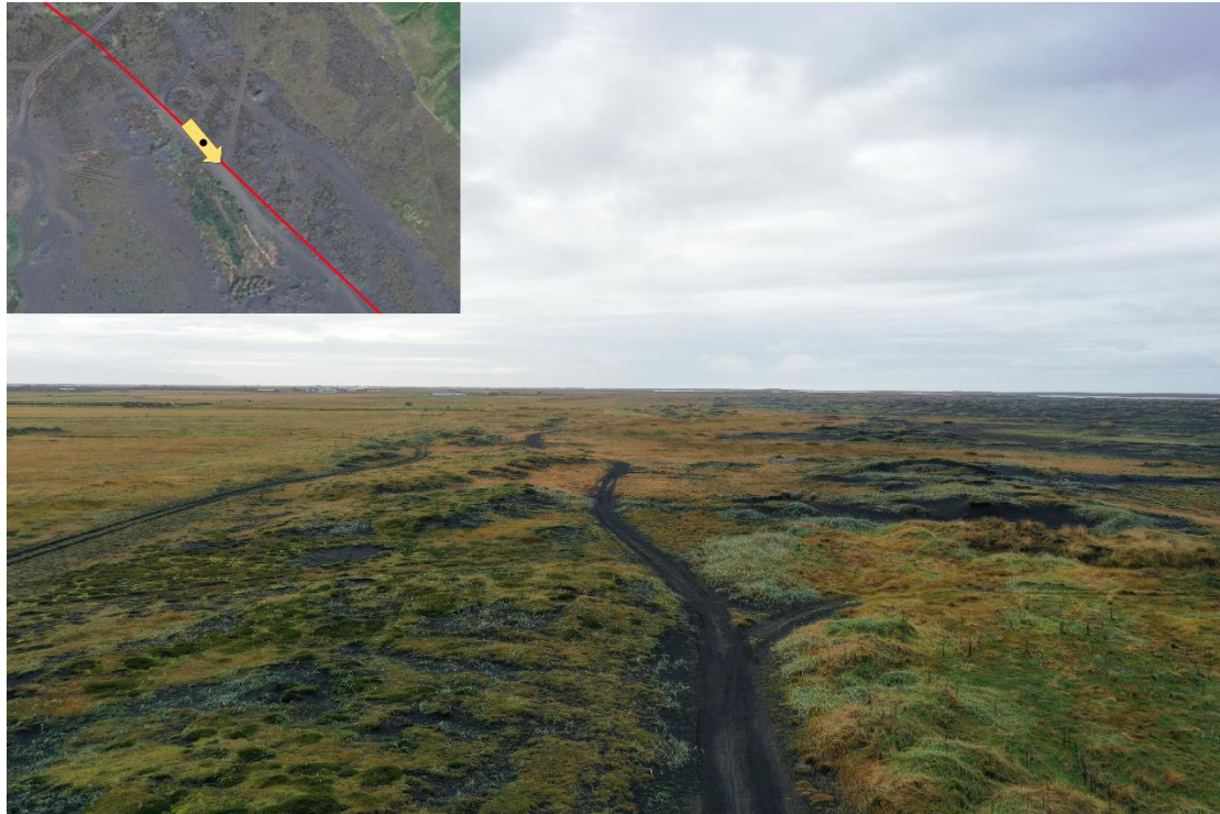
Mynd 7 - Fyrirhuguð lagnaleið er hér u.þ.b. fyrir miðri mynd, meðfram vegslóðanum. Vinstra megin á myndinni má sjá girðingar og tún í rækt. Strengurinn verður plægður norðan megin við vegslóðann á þessum slóðum.