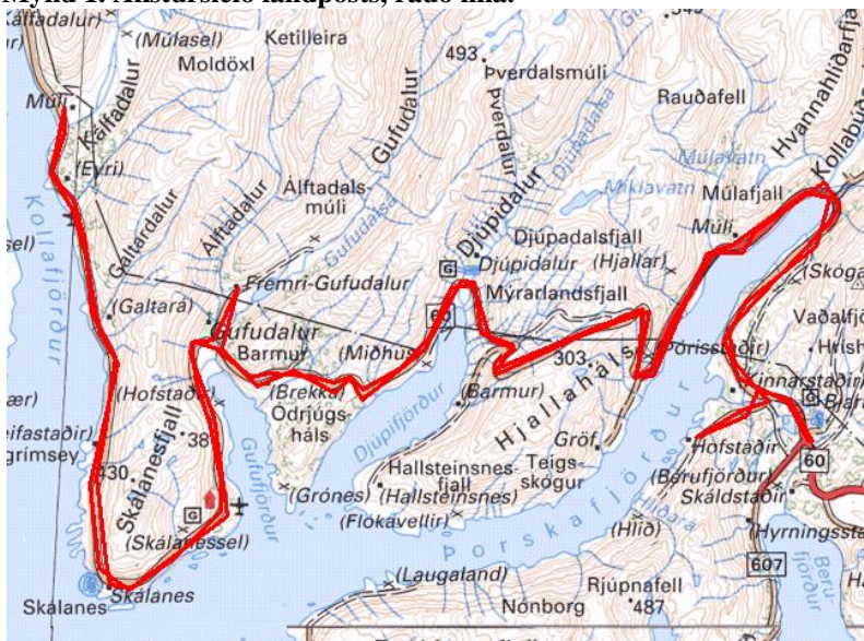
Mynd 1. Akstursleið landpósts, rauð lína.

Samtals er um að ræða 113 km sem eknir eru dagleg vegna dreifingar á þessari leið.