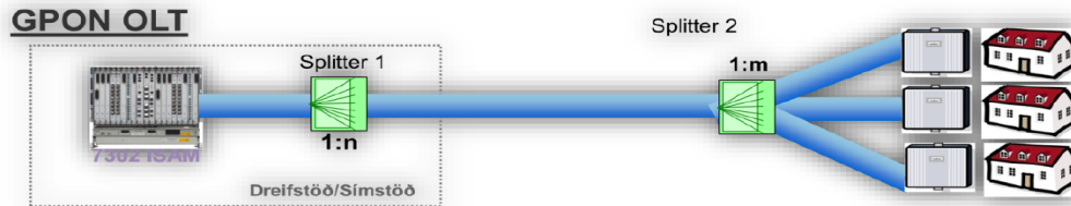
Mynd 1: Dreifð deiling

honum í svokölluðum ljósleiðarahúskössum sem skulu innihalda tengilista (e. Patch panel) svo hægt sé að tengja inn á innanhúsljósleiðaralagnir húsa. Sá frágangur minnkar líkurnar verulega á því að ljósleiðarinn verði fyrir skemmdum á heimilum notenda.